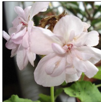
Pelargonie, Pelargonium , "Årsmødepelargonien"