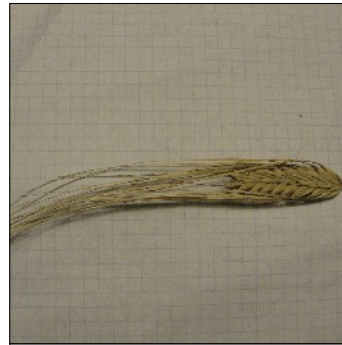
Byg, Hordeum sp., Viftebyg