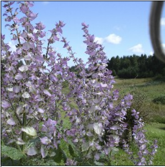
Skarleje, Salvia sclarea var. turkestanica