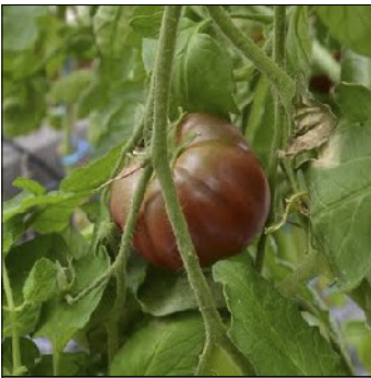
Tomat, Lycopersicon esculentum , Black from Tula