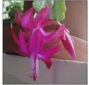
Novemberkaktus, Schlumbergera x buckleyi