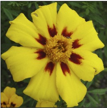
Tagetes, Tagetes patula , Exquisite