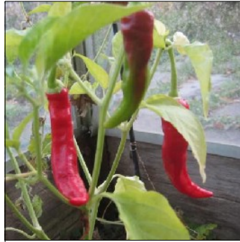
Chili, Capsicum annuum , Guindilla