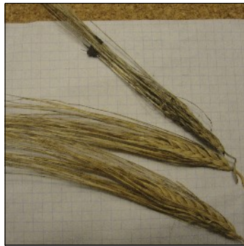
Byg, Hordeum sp., Stjernebyg fra Færøerne , NGB4701