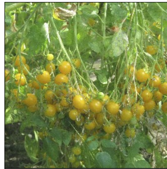
Tomat, Lycopersicon esculentum , Estisk gul cherry, FS007