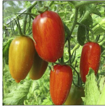
Tomat, Lycopersicon esculentum , Sweet Casady (Foto: LT)