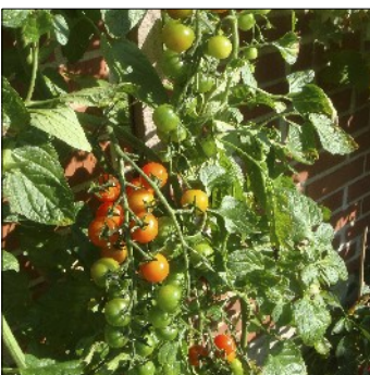
Tomat, Lycopersicon Esculentum , Mei Wei, FS088