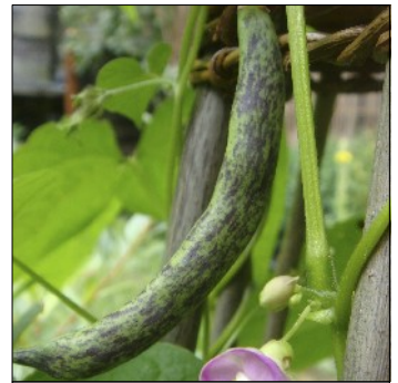
Havebønne, Phaseolus vulgaris , Kjems pea bean, FS206