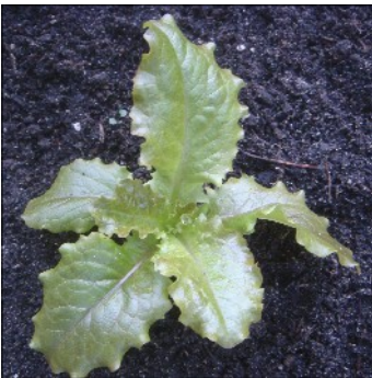
Havesalat, Lactuca sativa , Lattughino 'Riccio Lollo' , FS013