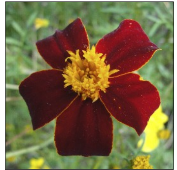
Tagetes, Tagetes spp., Ildkongen, FS318