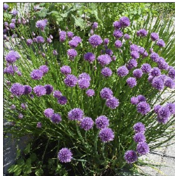
Purløg, Allium schoenoprasum , Forescate, FS562