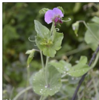
Ært, Pisum sativum , Spring Blush, FS611