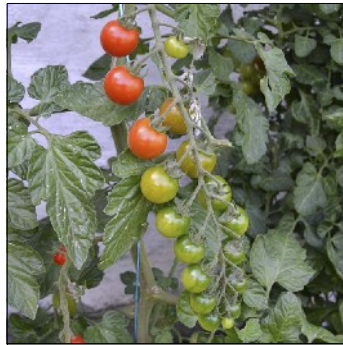
Tomat, Lycopersicon esculentum , Philovita