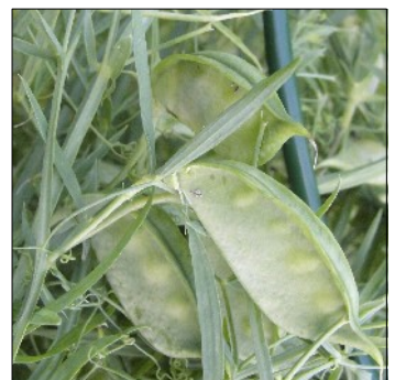
Græsfladbælg, Lathyrus sativus , Ravan Goroh, FS661